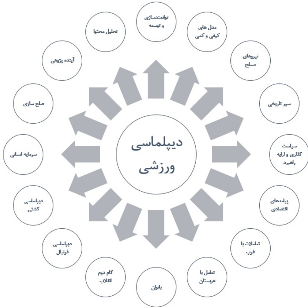
شکل ۱. مفاهیم پژوهشی مرتبط با دیپلماسی ورزشی در نشریات علمی مصوب داخل کشور